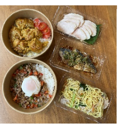
料理代行 ゴリラキッチン