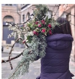
La fleuriste qui chantent.