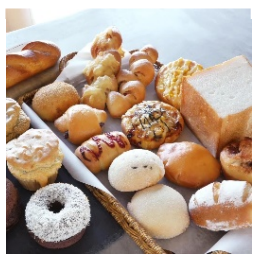
米粉パンの さんぼんパン