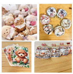
ハンドメイド雑貨 こもれび